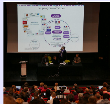
Journée de présentation V2

La deuxième partie a permis à certains projets d'utilisation de la solution logicielle Vitam de faire état de l'avancement de leurs travaux :