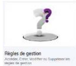
Règles de gestion Ajouter, Créer, Modifier ou Supprimer les règles de gestion